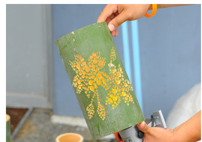
パークスタッフが作成した竹あかり