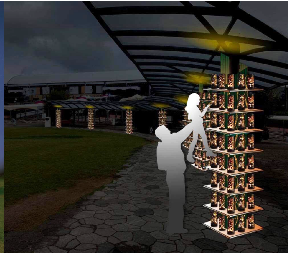
竹あかりの光の回廊「循環の環」 作りした「思いの竹あかり」